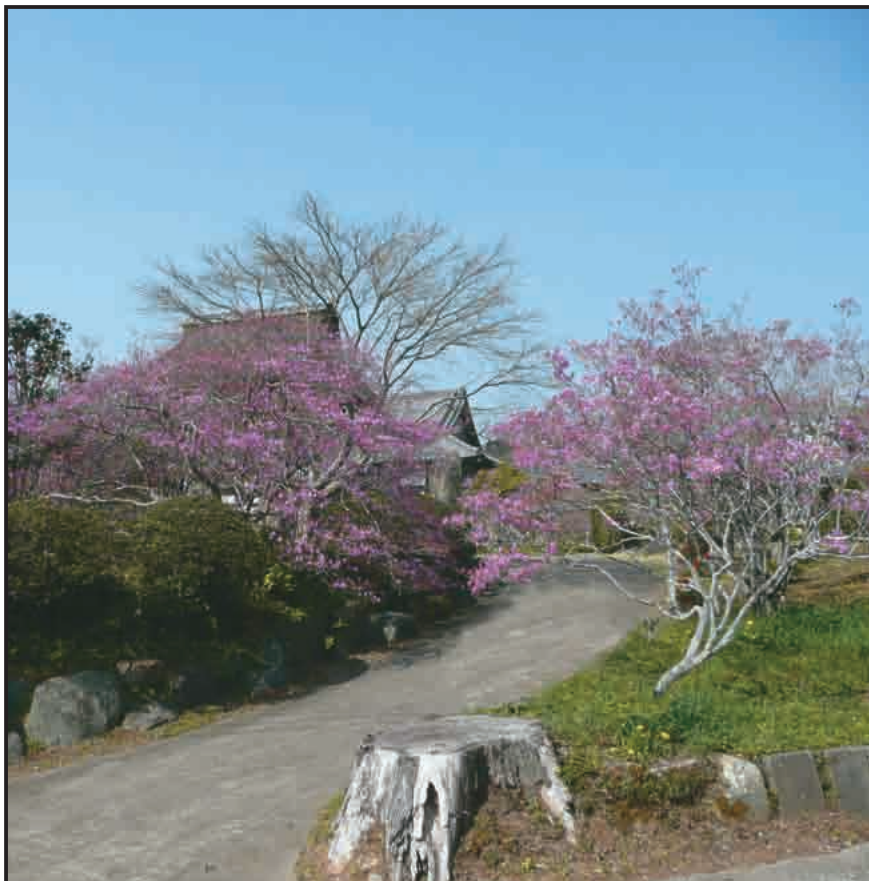
キヨスミミツバツツジ(千葉 房総)編集部