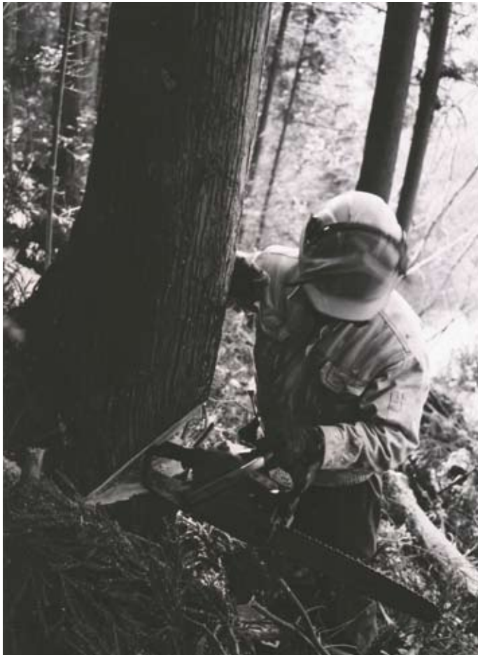
編集代表 梶井 功

農村と都市をむすぶ 二〇〇九年八月号(第六九四号) 特集 森林の再生と山村の活性化